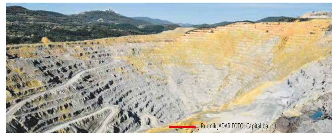
Rudnik JADAR