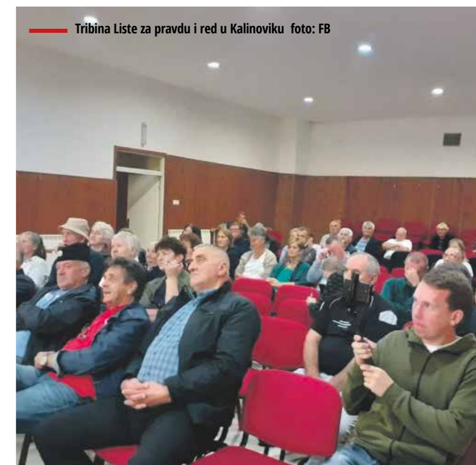
Tribina Liste za pravdu i red u Kalinoviku